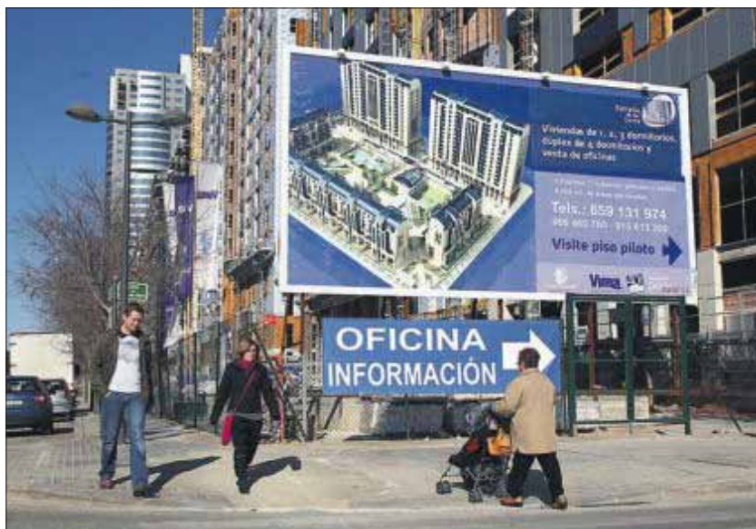
Promoción de viviendas en la avenida de las Cortes Valencianas, de Valencia. JORDI VICENT

Engordado con dinero foráneo y ladrillos españoles, el monstruo explotó a mediados de 2007. La crisis venía de fuera, de la mano de las hipotecas subprime de Estados Unidos, pero se vio agudizada por los desequilibrios que había permitido