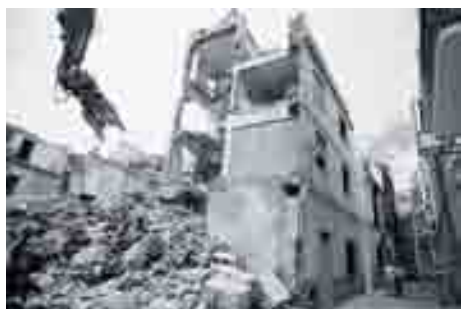
Muro de las Catalinas.

clases sociales, no sólo del siglo XIX y XX, sino incluso con anterioridad. La diversidad de categorías arquitectónicas y de los recorridos públicos era muy diferente por ejemplo en el entorno de la catedral, calle Cister o San Agustín, que en la corona noroeste que enlaza calle Camas con Mosquera a lo largo de Carretería y Pozos Dulces. Las personas que habitaban esos diferentes espacios también eran muy diferentes en sus características socioeconómicas, y todavía hoy esas diferencias físicas y sociales son muy apreciables.