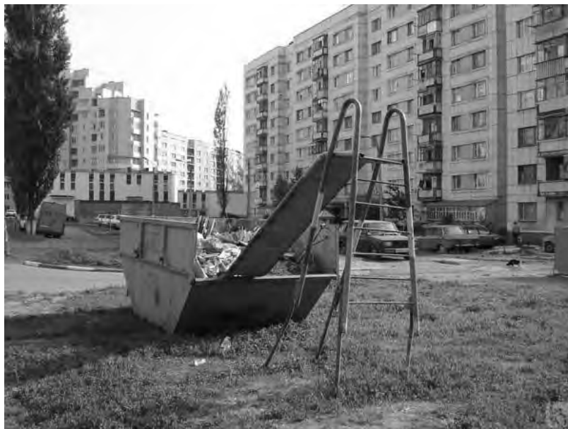
Sad Playground, como lo encontró Peter Fischli en la World Wide Web, 2013

La exposición aborda el potencial socializador, transgresor y político del juego cuando aparece vinculado al espacio público. Desde la tradición popular del carnaval se reconoce la posibilidad de subvertir, reinventar y trascender, aunque sea temporalmente, lo cotidiano devenido en mero ejercicio de supervivencia. El reconocimiento de la existencia de una comunidad de bienes y la necesidad de tiempo libre, en contraposición directa al tiempo de trabajo, constituyen dos constantes fundamentales del imaginario utópico a lo largo de la historia. El espacio público, como ámbito que sintetiza la noción de comunidad de bienes, se materializa en la experiencia de la participación ciudadana.