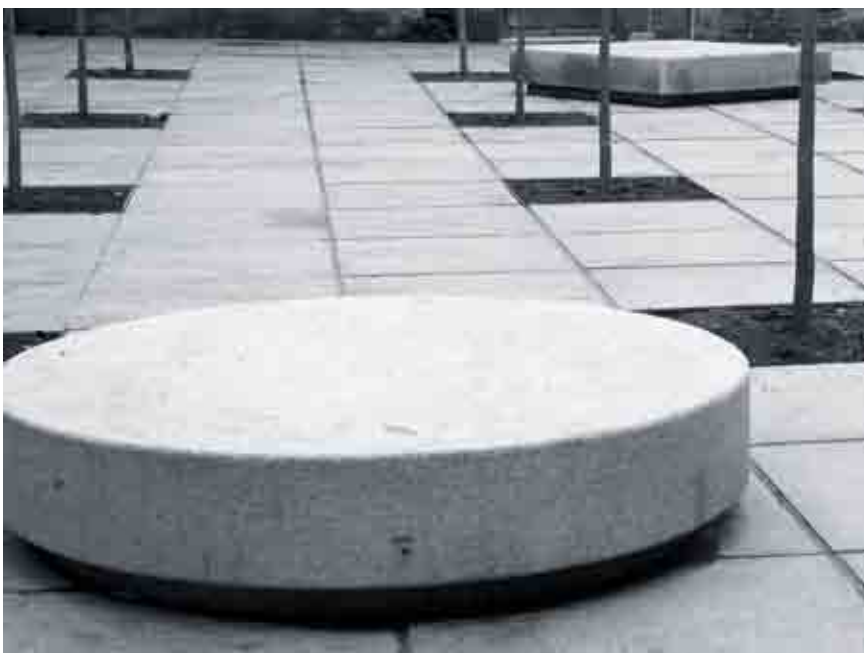
Mobiliario y pavimento nuevos en la plaza del Pericón.

Los rótulos se han realizado cómodamente mediante el estarcido de pintura al esmalte sobre plantillas de vinilo y el criterio de su ubicación asume la posibilidad de su deterioro o incluso su desaparición cuando así le ocurra al soporte. No actúan desde la prepotencia sino desde la sintonía con la evolución del estado de la edificación, a la que se adhieren en una suerte de simbiosis cargada de significados.