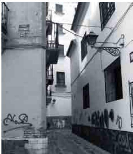
Pozos Dulces, estado actual.