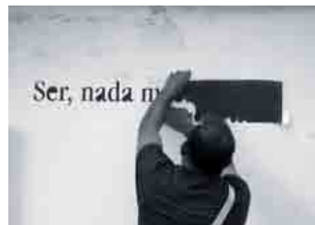
Para realizar los textos murales se usaron plantillas de vinilo.