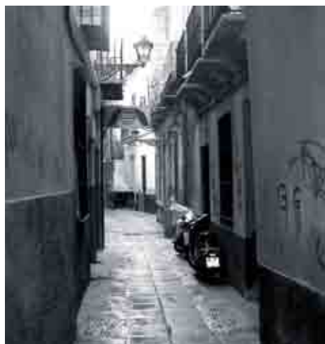
Estado actual de Pozos Dulces.

to de gran potencia visual que ejerce de sosegado contrapunto al complejo lenguaje de paños, huecos y cerrajería de la interesante arquitectura doméstica que conforma el resto de la calle; la poética pared tras fluir con elegancia vuelve a la derecha transformándose en portada neoclásica del conjunto religioso y articulando de forma tan simbólica como eficaz la conexión entre las vías citadas. Este muro barroco, sin duda, o quizá junto con los vestigios del sistema defensivo, es pieza clave para entender e interpretar la estructura urbana del sector. Su protagonismo histórico y sobre todo plástico es indiscutible de modo que no es de extrañar que la calle Arco de la Cabeza a partir del convento cambie de denominación tomando el nombre de esta pieza arquitectónica.