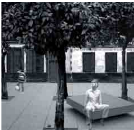
Propuesta para la plaza del Pericón.