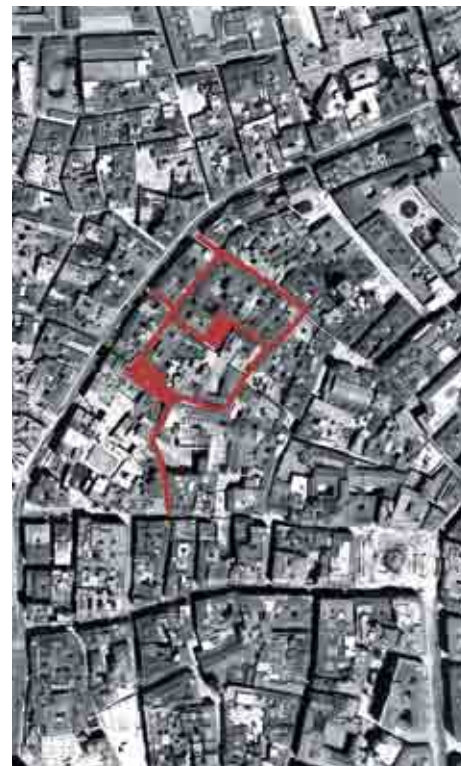
Vista aérea del anillo formado por las calles Arco de la Cabeza, Andrés Pérez y Pozos Dulces alrededor de la plaza del Pericón.

El antiguo convento de las Religiosas Dominicas de la Divina Providencia llamado de las Catalinas en referencia a la santa bajo cuya advocación se pusieron a finales del siglo XVIII la iglesia y el propio convento, actúa de charnela entre la calle Arco de la Cabeza y la de Pozos Dulces siendo el elocuente muro casi ciego que lo cierra a la primera de las calles citadas un poderoso elemen-