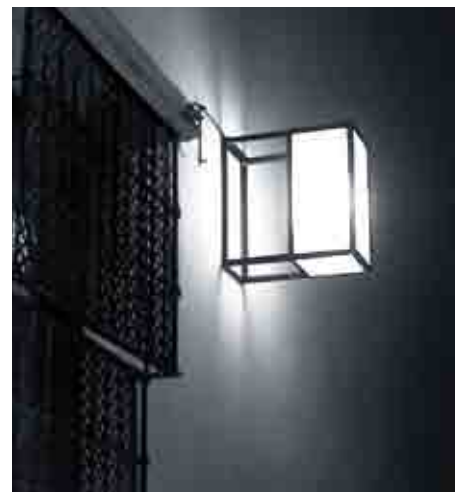
Las nuevas farolas responden al deseo de un diseño discreto y elemental.

La propuesta física no es nueva: el uso de las paredes como vehículo de mensajes es tan antiguo como la propia ciudad. Sin necesidad de remontarse a los sabidos casos de las inscripciones en las calles de la época romana, son notables las frases, iniciales, vítores, etc que ilustran los muros de muchas universidades (Baeza, Salamanca,...) y en tiempos más próximos, ideologías sin otros cauces para la expresión, vieron en la brocha y en las paredes las mejores herramientas para la convicción. Luego, desde los setenta del pasado siglo, los grupos urbanos más o menos contraculturales descubrieron el enorme potencial expresivo del espray. Así las ciudades se llenaron de mensajes que constituyeron (y aún hoy) una inequívoca señal de identidad de