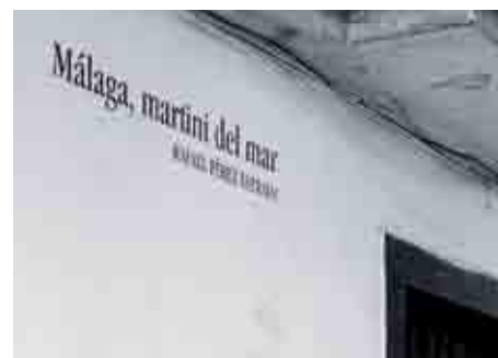
Frases universales llenan la paredes del sector.