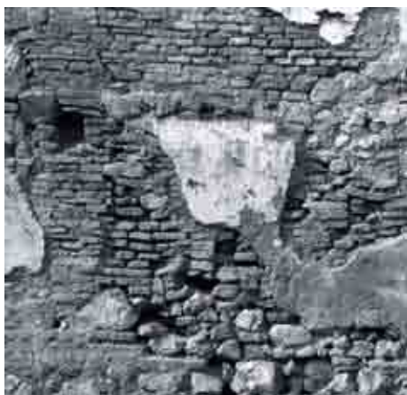
Restos de la muralla medieval.

unía el más que deficiente pavimento, a veces incluso inexistente, la precaria iluminación (circunstancia que en alguna esquina parecía no desagradar a ciertas personas dedicadas a ciertas actividades) y la ausencia de equipamiento y servicios.