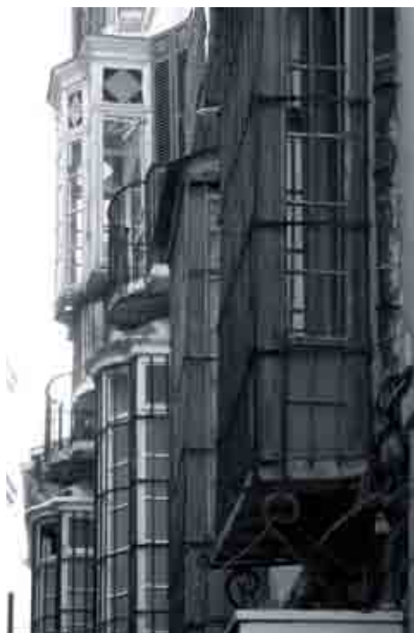
Balcones y cierros barrocos.