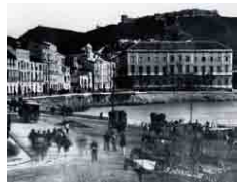
Málaga, siglo XIX.