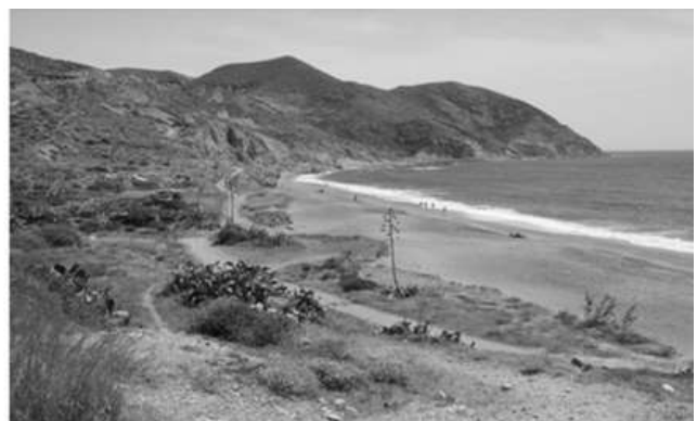
7 A y B_Estado previo del hotel de El Algarrobico (izda.), y propuesta de renaturalización de la playa (dcha.) (n'UNDO)