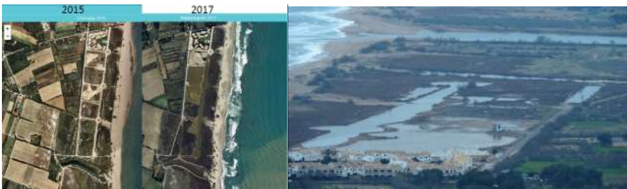
6 A y B_Proyecto y obra de Desurbanización y recuperación de la funcionalidad ecológica en los sistemas costeros de La Pletera. Proyecto Life Natura (LIFE13 NAT/ES/001001) Càtedra d'Ecosistemes Litorals Mediterranis (Universitat de Girona y Ajuntament de Torroella de Montgrí- l'Estartit) (Quintana, Xavier, 2019)

La desurbanización y restauración ambiental realizada ha consistido en: desconstruir la urbanización costera, paralela al litoral de dunas; recuperar la funcionalidad original de los ecosistemas dunares (flora y fauna). Recuperar la funcionalidad original de los ecosistemas de las marismas en las zonas de las calles desurbanizadas (Quintana, 2019). Y como ideas no realizadas, pero pensadas durante el proceso de desurbanización: solicitar al banco dueño de los terrenos a desurbanizar subvención para las obras de demolición, justificada en las ayudas medioambientales que el propio banco oferta y publicita; se plantea la posibilidad de compra por el ayuntamiento de la edificación litoral, y financiar progresivamente mediante plataformas digitales de vivienda de uso turístico su demolición.