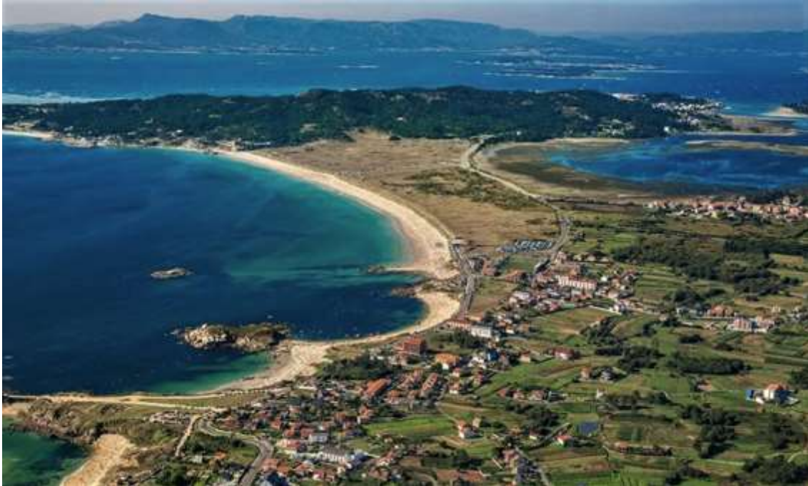
2_Estado final de la playa de A Lanzada tras la demolición de carretera sobre el sistema dunar, sistema dunar restaurado y la nueva carretera realizada en el interior del istmo

En este proyecto hubo distintas propuestas que se confrontaron públicamente. Sin embargo, tanto los empresarios de la zona al conseguir una nueva carretera de cuatro carriles en la conexión con O Grove, como los grupos ecologistas al haberse realizado la restauración ecológica, quedaron conformes con la actuación. El resultado principal actual es el mantenimiento y la consolidación del ecosistema dunar junto a la playa de alto uso turístico (Agrasar, 2021).