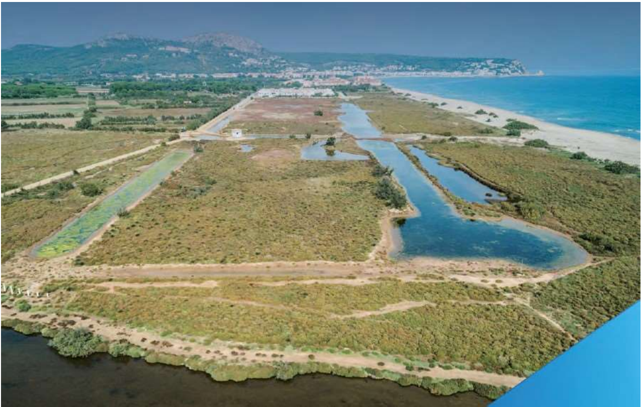
5_Proyecto y obra de desurbanización y recuperación de la funcionalidad ecológica en los sistemas costeros de La Pletera en Estarrit, Torroella de Montgrí.

En 2004, la urbanización de La Pletera queda dentro del límite de dominio público marítimo terrestre: el sector es declarado suelo público, no urbanizable y protegido. A partir de 1999, el Ayuntamiento de Torroella de Montgrí ha ejecutado 3 proyectos en el marco del programa LIFE (1999-2018), con una inversión total de 5,3 millones de euros (50% financiado por la UE y el resto por el ayuntamiento y otros socios).