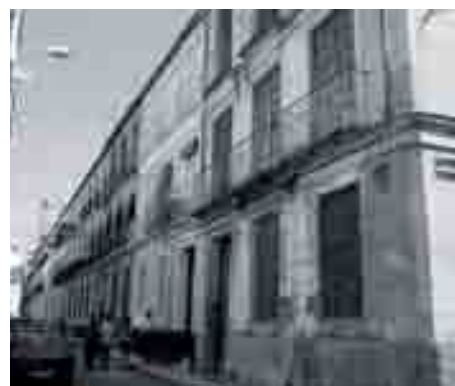
Actuaciones inmobiliarias en solares procedentes de la desamortización.

LA BURGUESÍA SE INSTALA EN CALLES HECHAS A SU MEDIDA