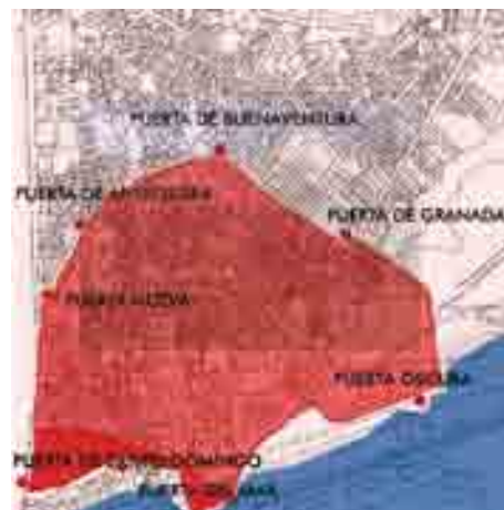
Las puertas de acceso a la ciudad.