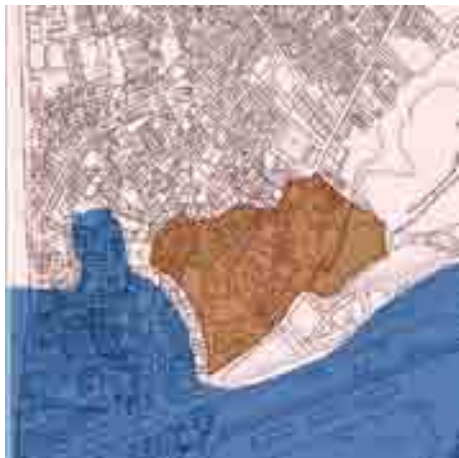
La Málaga romana.