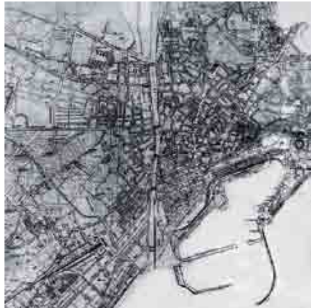
Plano de finales del siglo XIX.