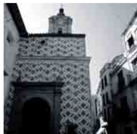
La Iglesia de San Juan antes y después de la recuperación de las pinturas de su fachada llevada a cabo por la Oficina de Rehabilitación.

LOS PROCEDIMIENTOS, LA METODOLOGÍA, LAS TÉCNICAS EMPLEADAS EN LA EXPERIENCIA DE MÁLAGA HAN SIDO RECONOCIDAS EN FOROS INTERNACIONALES