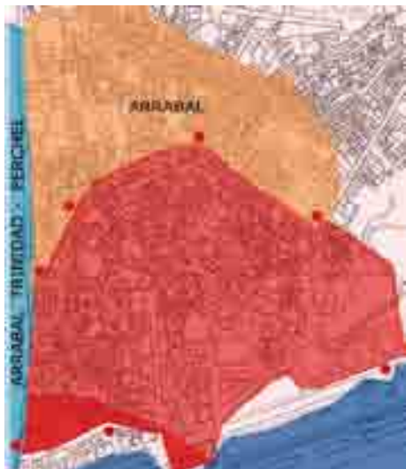
La medina amurallada Nazari del siglo XIII.