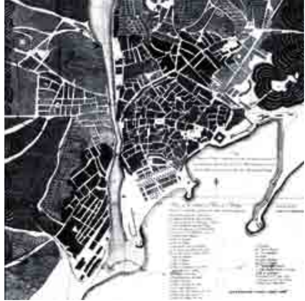
Plano de Onofre Rodríguez, 1805.