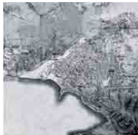
Plano de la ciudad. 1700.