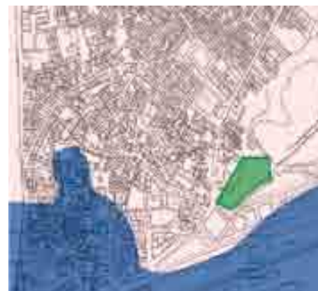
La Málaga fundacional se asienta en la ladera de Gibralfaro.

La cultura y permanencia romana desde el siglo III antes de la era cristiana hasta bien entrado el siglo IV no nos han creado un sentimiento de "procedencia"... Siete siglos latinos, un teatro, unos ciudadanos no sometidos por la fuerza, sino por el convencimiento de ser regidos por unas leyes propias, la LEX FLAVIA MALACITANA, de las que se guarda un excepcional testigo en