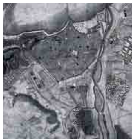
Plano de Bartolomé Thurus. 1717.