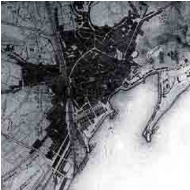
Plano de Antonio de Mesa, 1863.