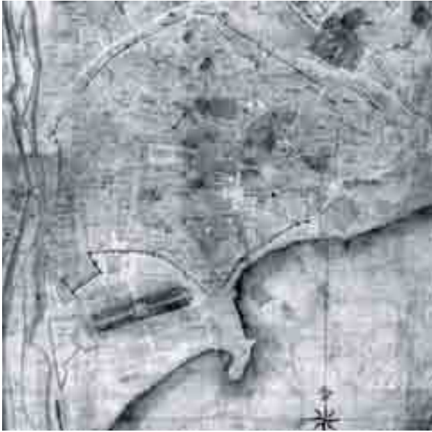
Plano de Carrion de Mula, 1791.