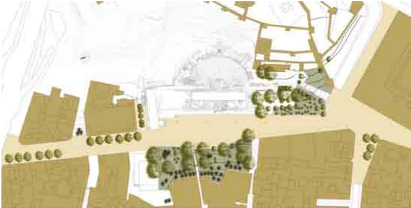
Planta general de la remodelación.

El conjunto de piletas, en muy buen estado de conservación, aparece con los muros del recinto en que estaban confinadas, a una cota que hace que sea posible dejarlas a la vista bajo la calle, con acceso desde el Teatro Romano. Entre éste y las piletas hay un pavimento de spigatum cerámico, resto de unas termas romanas de época republicana que se amortizaron para la construcción del Teatro. Parte de este pavimento, que estaba ya descubierto pero se ha completado con las últimas excavaciones, quedará también bajo la calle.