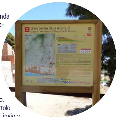
▲ Panel de inicio

La última etapa del GR-242, Gran Senda de la Axarquía, tiene una clara orientación norte-sur. Desde Moclinejo se gana el lomo interfluvial entre el río de Benagalbón y el arroyo Granadillas. Por dicho corredor de altura se solapa con la Vereda de la Cuesta de Granadilla. Las panorámicas desde esta vía pecuaria son amplias y abarcan a la totalidad de la Axarquía. La dinámica cambia poco antes de cubrir el ecuador del recorrido, justo cuando nos topamos con el cerro Bartolo y con la linde de los municipios de Moclinejo y Rincón de la Victoria. Será en ese momento cuando descendamos por la vertiente de poniente hacia el cauce del arroyo Granadillas, que será nuestro hilo conductor hasta alcanzar la playa de Rincón de la Victoria, donde conecta con el GR-249 (Gran Senda de Málaga).