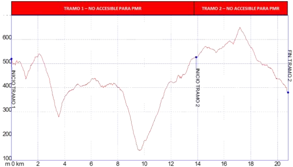
Gráfica 1: Identificación tramos etapa28, nivel de accesibilidad.

Los tramos que se han identificado en la etapa 28 Genalguacil – Casares para personas con movilidad reducida son los siguientes: