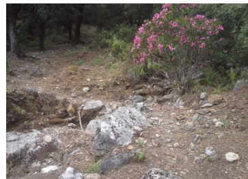
WPT6. Cruce de arroyo