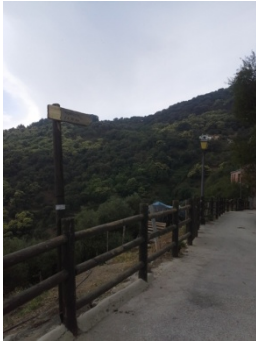
WPT1. Inicio de sendero y de coincidencia con GR 141 Etapa 4, GR 249 Etapa 27 y PR-A 291