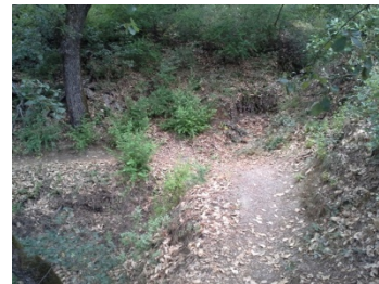
WPT4. Cruce de arroyo