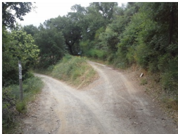
WPT3. Fin de coincidencia con GR 141 Etapa 4, GR 249 Etapa 27 y PR-A 291