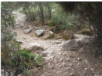
WPT5. Cruce de arroyo