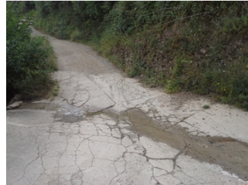
WPT2. Cruce arroyo