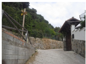
WPT7. Inicio de coincidencia con SL-A 177