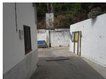
WPT8. Fin de sendero y de coincidencia con SL-A 177