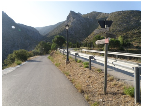
WPT5. Inicio de coincidencia con GR 243 Etapa 8