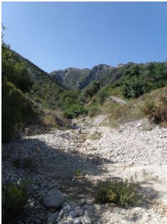
WPT3. Enlace con PR-A 136