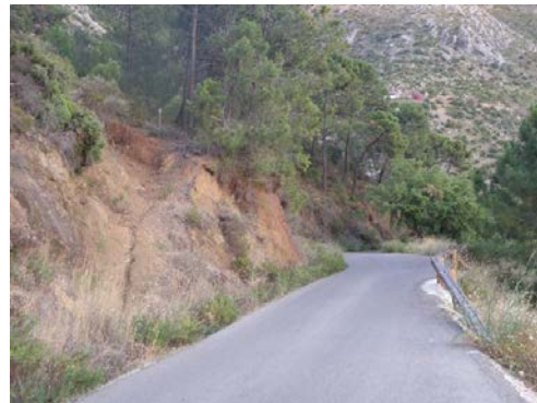
WPT4. Inicio de coincidencia con PR-A 136