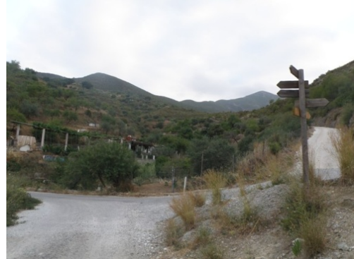
WPT2. Fin de coincidencia con GR 243 Etapa 7