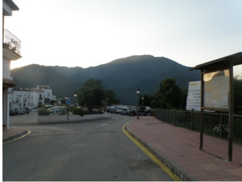
WPT7. Fin de etapa y de coincidencia con GR 243 Etapa 8