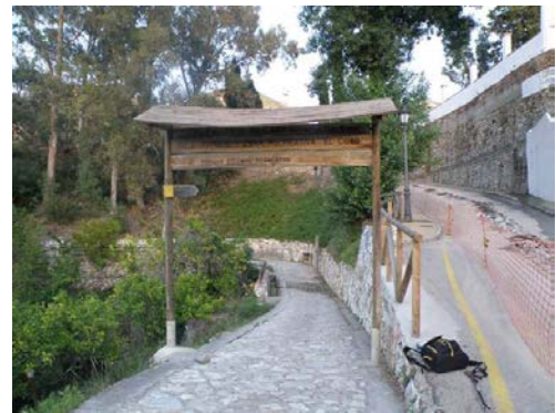
WPT6. Fin de coincidencia con PR-136