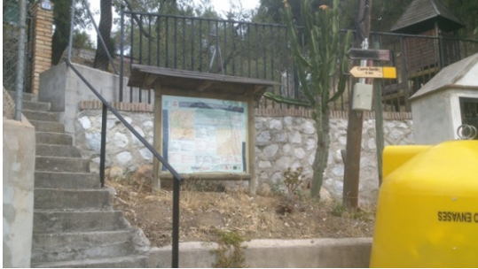
WPT1. Inicio de etapa y de coincidencia con GR 243 Etapa 7