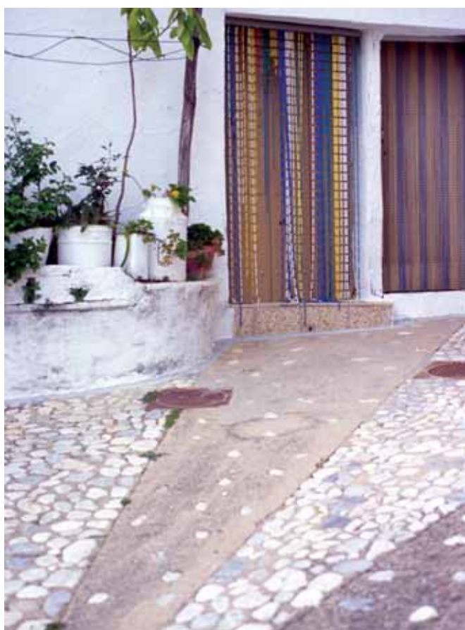
Puerta de Igualeja