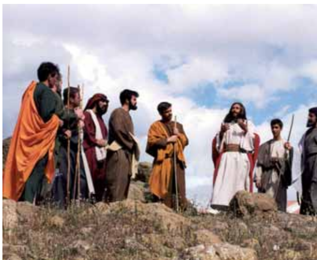
Sermón en la Montaña

Las salidas procesionales de Jesús Nazareno y la Virgen de los Dolores no son menos hermosas.