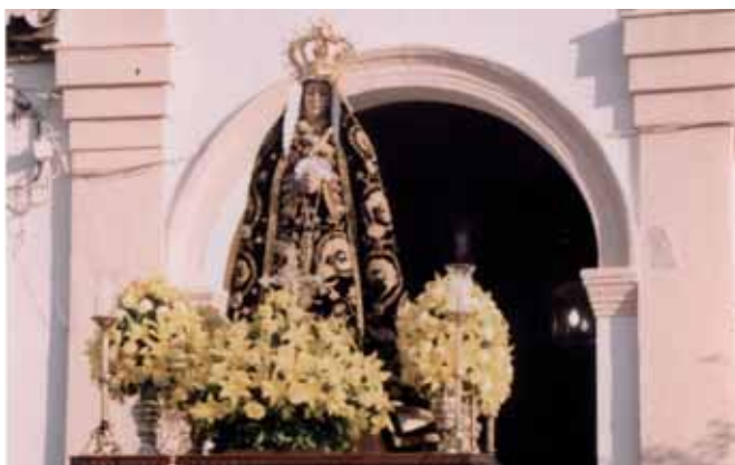
María Santísima de los Dolores

Como en la mayor parte de los municipios andaluces, la Semana Santa es también aquí una de las festividades religiosas más señaladas. Tiene especial importancia el Domingo de Resurrección, día en que se celebra la quema del Judas: cuando las imágenes de la Virgen de la Medalla Milagrosa y del Corazón de Jesús se encuentra con la imagen de Judas en la Plaza de Abajo, entre tracas y fuegos de artificio arde el muñeco de trapo mientras el pueblo festeja la Resurrección de Cristo y el triunfo sobre el pecado.