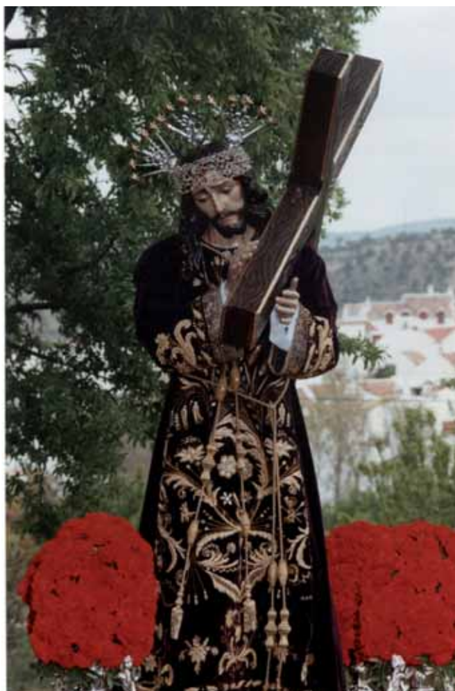
Padre Jesus Nazareno. Subida al Calvario