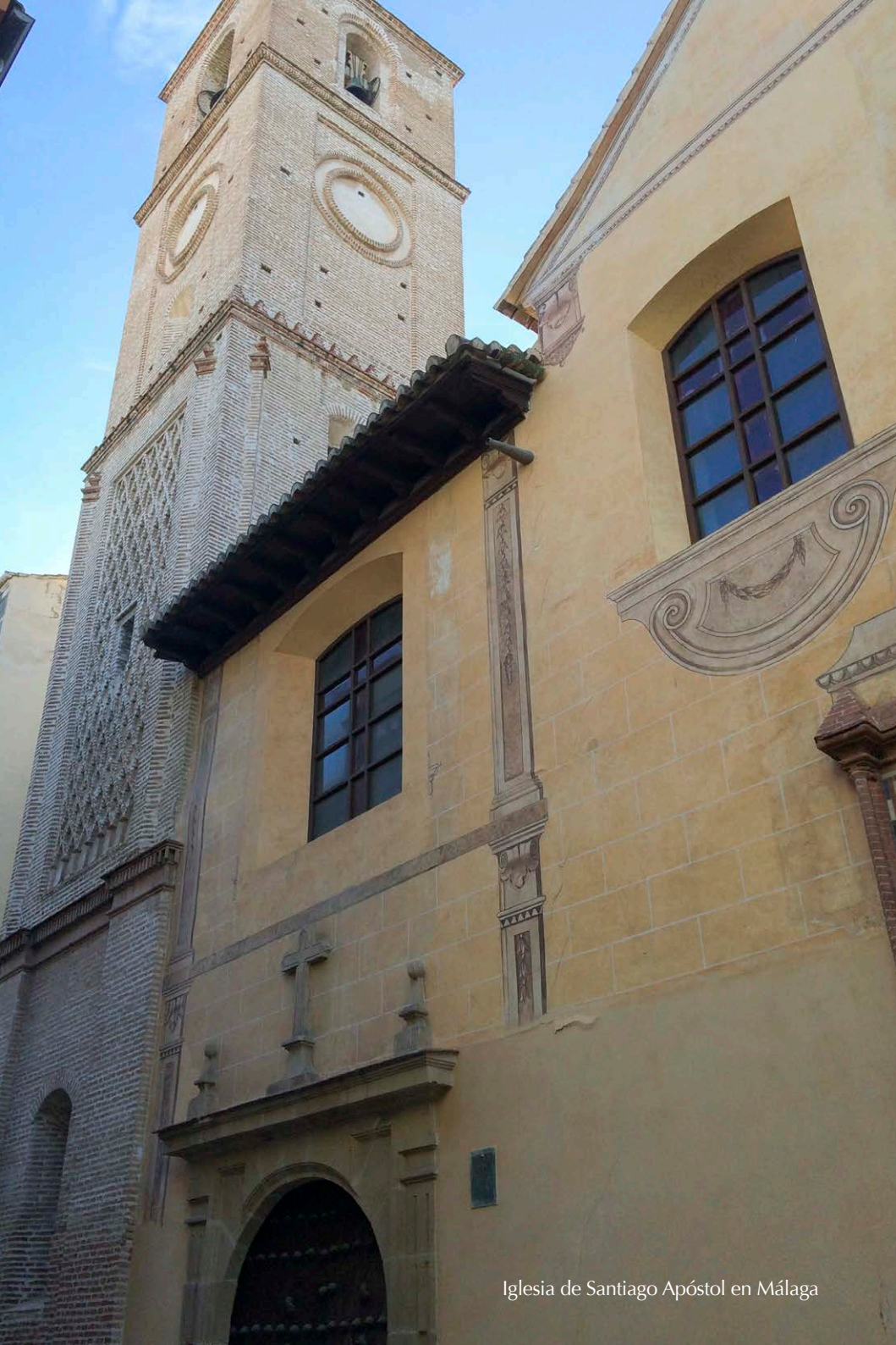
Iglesia de Santiago Apóstol en Málaga