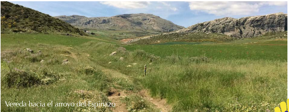
Vereda hacia el arroyo del Espinazo