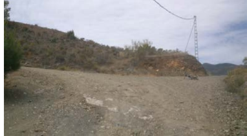
WPT2. Enlace con bifurcación del PR-A 279