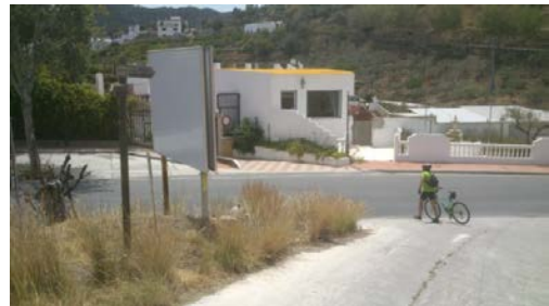
WPT3. Fin de etapa