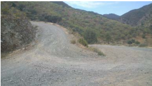
WPT3. Fin de coincidencia con PR-A 179