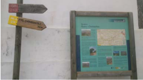
WPT1. Inicio de etapa y de coincidencia con PR-A 279. Enlace con GR 243 Etapa 4