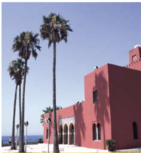
BENALMÁDENA. Castillo del Bil-Bil.

Ya se están desarrollando en los municipios beneficiados por el Plan Qualifica –Torremolinos, Benalmádena, Fuengirola, Mijas, Marbella, Estepona, Casares y Manilva– los primeros proyectos, centrados básicamente en la modernización de la planta hotelera, la promoción y comercialización del producto y la revalorización de los espacios urbanos de estos ocho municipios.