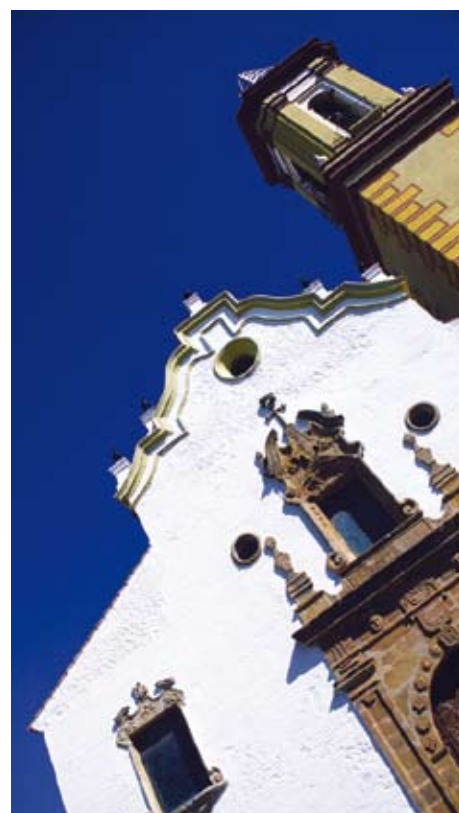
ESTEPONA. Virgen de los Remedios.

El consorcio Desarrollo y Turismo de la Costa del Sol no sólo garantiza la correcta ejecución del Plan Qualifica, sino que va más allá, siendo el instrumento fundamental para el acuerdo y el trabajo coordinado y conjunto de todos los agentes implicados, para conseguir el reto de garantizar la competitividad turística de la Costa del Sol a largo plazo, consolidándola como uno de los destinos emblemáticos a nivel mundial. ▶