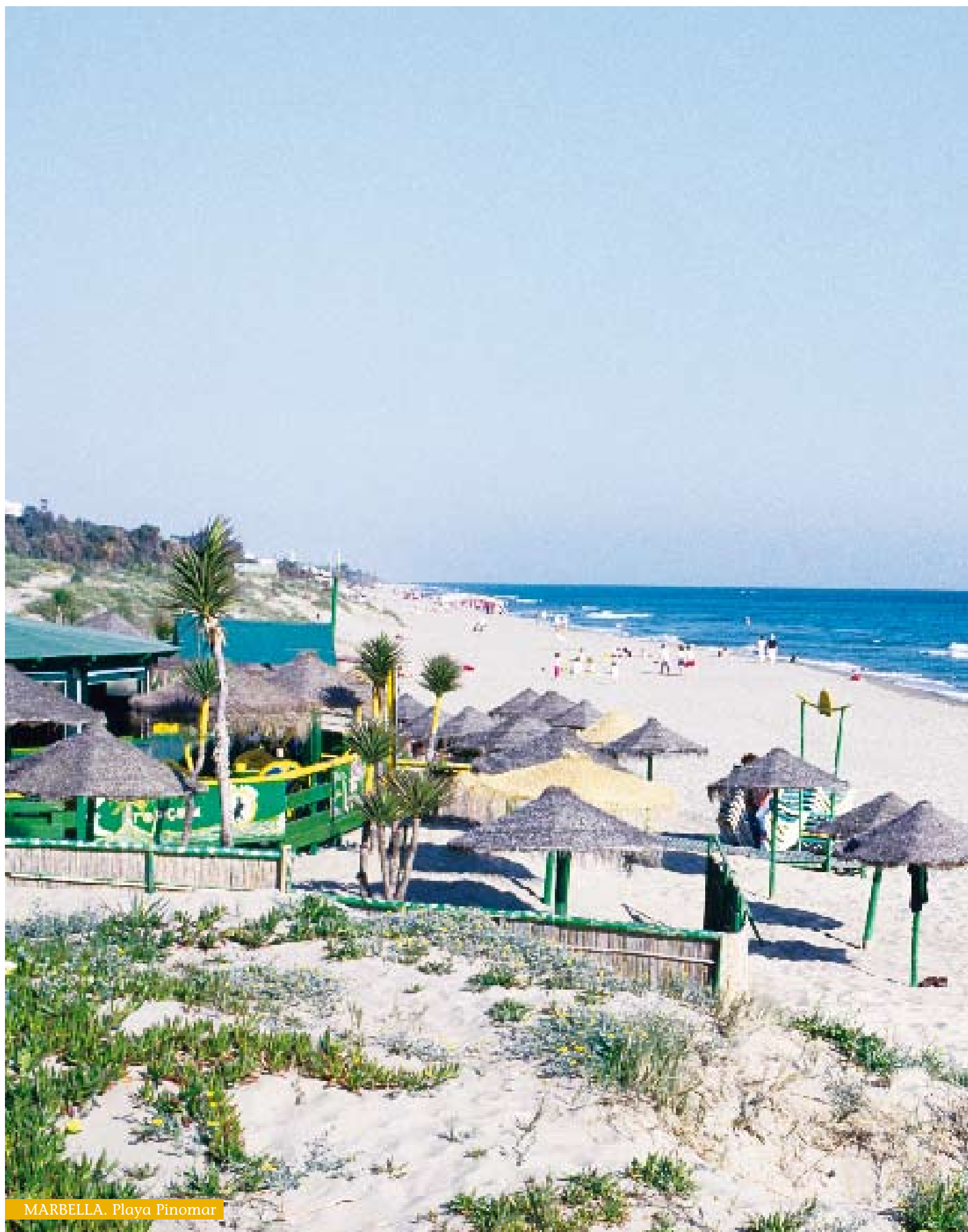
MARBELLA. Playa Pinomar