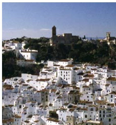
TORREMOLINOS. La arquitectura característica del Auditorio Municipal. A la dcha., Casares.

Podemos afirmar sin miedo a equivocarnos que la Costa del Sol es la principal zona turística de Andalucía y una de las más importantes de España, como prueban las cifras anuales de visitantes y pernoctaciones. La gran fortaleza de este destino malagueño se basa en su espléndida oferta de sol y playa así como de otros segmentos en auge como golf, congresos, náutica o el de salud y belleza . Pero no hay que olvidar que la Costa del Sol es un destino maduro que debe consolidar sus niveles de calidad y competitividad; con ese objetivo nace el Plan Qualifica .