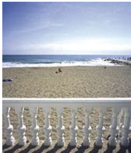
MANILVA. El puerto de la Duquesa, una zona emblemática. A la dcha. playa de Fuengirola.