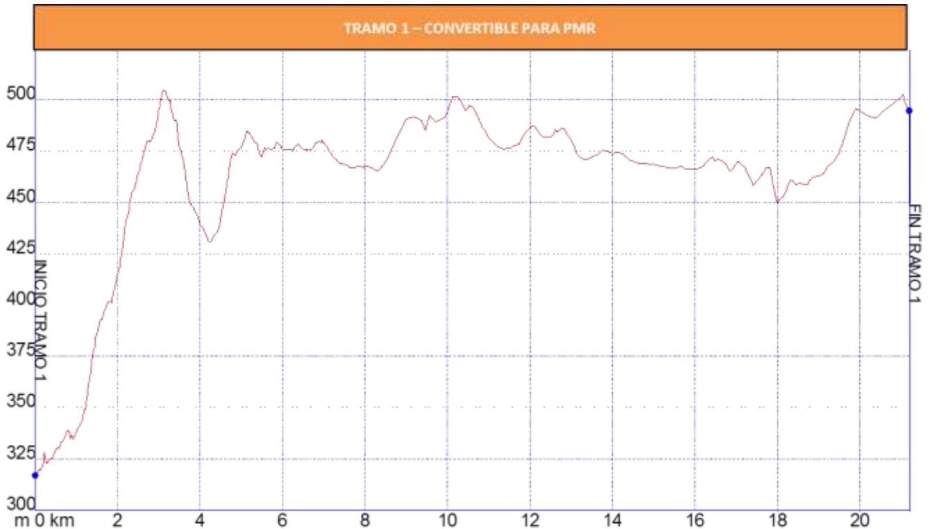
Gráfica 1: Identificación tramos etapa 16, nivel de accesibilidad.

Los tramos que se han identificado en la etapa 16 Cuevas Bajas - Alameda para personas con movilidad reducida son los siguientes: