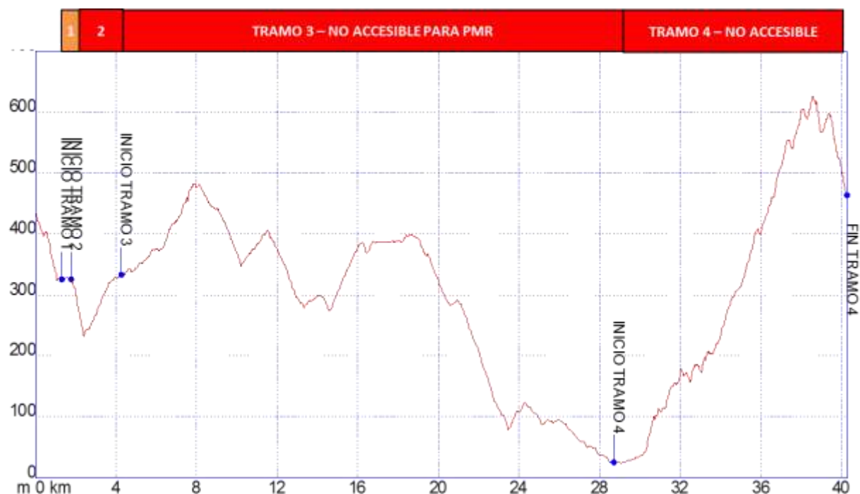
Gráfica 1: Identificación tramos etapa32, nivel de accesibilidad.

Los tramos que se han identificado en la etapa 32 Ojén – Mijas para personas con movilidad reducida son los siguientes: