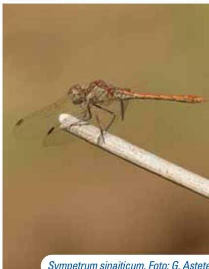
Sympetrum sinaiticum .

Al regazo del cordón litoral costero central prorrumpen varios cursos fluviales, entre ellos los ríos Ojén y Alaminos, donde hallamos el hermoso paraje de Barranco Blanco. Ambos cauces, al unirse, conforman el Fuengirola, declarado por sus innegables valores medioambientales como ZEC. Algo más al este, al norte de la ciudad de Málaga fluye el río Guadalmedina entre un conjunto de suaves colinas cubiertas de almendros, olivos, quercíneas y pinares de repoblación que juegan un papel primordial en la lucha contra la erosión y evitan las avenidas e inundaciones producidas históricamente en la urbe malagueña. Actualmente es el