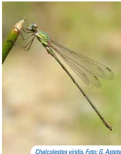
Chalcolestes viridis . Foto: G. Astete

El río Guadalhorce es el más importante de la provincia, tanto por su longitud como por su caudal. En el tramo medio-bajo vertebrata a una comarca natural asentada sobre materiales metamórficos y una llanura aluvial resguardada de los rigores invernales por un importante cinturón de montañas que le procuran un clima benévolo con ausencia de heladas. El valle se articula en una sucesión de fértiles tierras de labranza, con preponderancia del secano en las laderas y cultivos de regadío en las vegas. Como si de un embudo se tratase, el Guadalhorce, tras ser retenido junto a sus afluentes Turón y Guadalteba en un interesante complejo de embalses y tras labrar una grandiosa garganta en las calizas jurásicas de la sierra de Huma (Paraje Natural Desfiladero de los Gaitanes), se desparrama en busca del mar, ordenando un vasto valle de