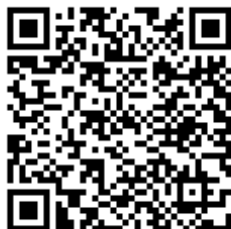
Código QR para validación en sede

Regulación CSV: Decreto 3628/2017 de 20-12-2017