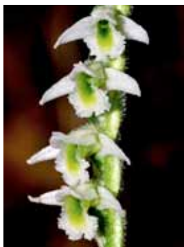
Spiranthes spiralis JRL