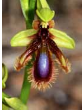
Ophrys vernixia JRL