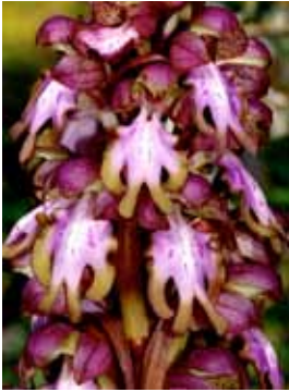
Himantoglossum robertianum JRL