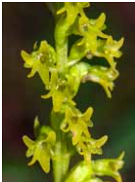
Gennaria diphylla JV