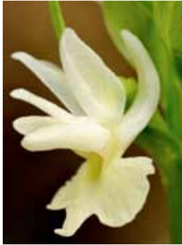
Dactylorhiza sulphurea PM