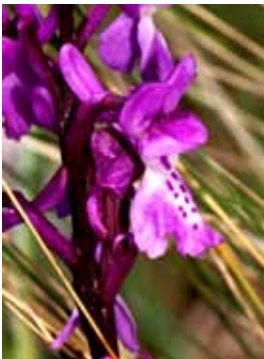
Orchis mascula subsp. olbiensis JRL