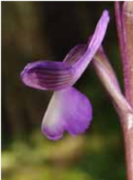
Anacamptis morio subsp. champagneuxii .