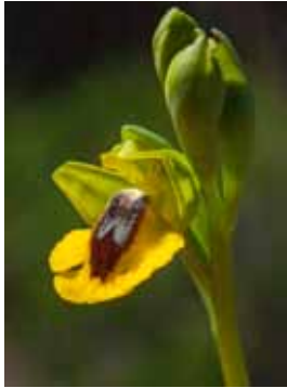
Ophrys lutea JV