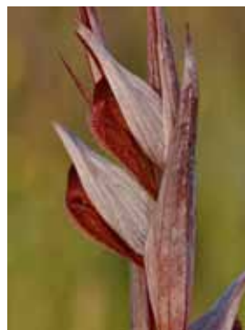
Serapias vomeracea JQ