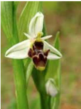
Ophrys scolopax var. picta