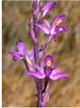
Limodorum abortivum JRL