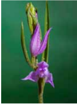
Cephalanthera rubra JV