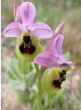
Ophrys tenthredinifera var. ficalhoana