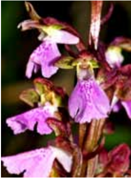
Orchis cazorlensis JRL