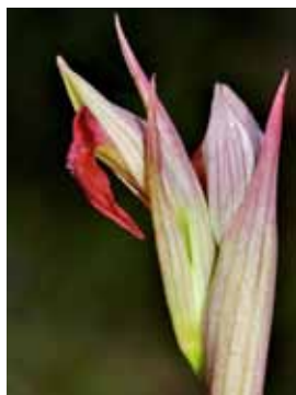
Serapias parviflora JRL