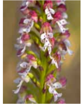
Neotinea ustulata JV