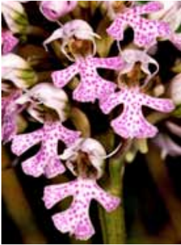
Neotinea conica JRL