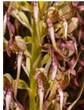
Himantoglossum hircinum JV