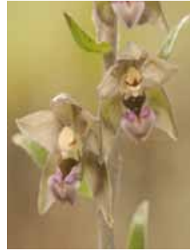
Epipactis lusitanica PM