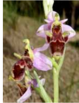
Ophrys scolopax JR