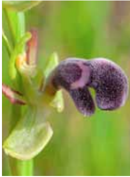
Ophrys dyris JV