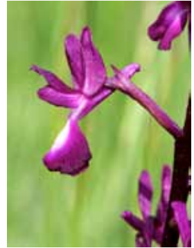
Anacamptis laxiflora JRL