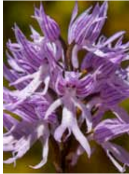
Orchis italica JV