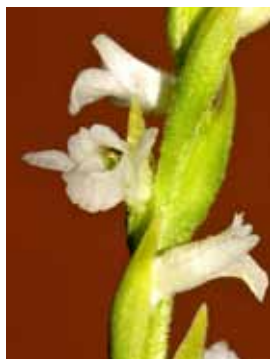
Spiranthes aestivalis JRL