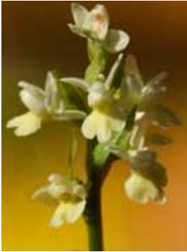
Dactylorhiza insularis JV