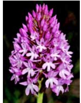
Anacamptis pyramidalis JRL