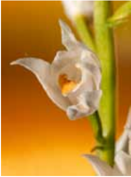
Cephalanthera longifolia JV