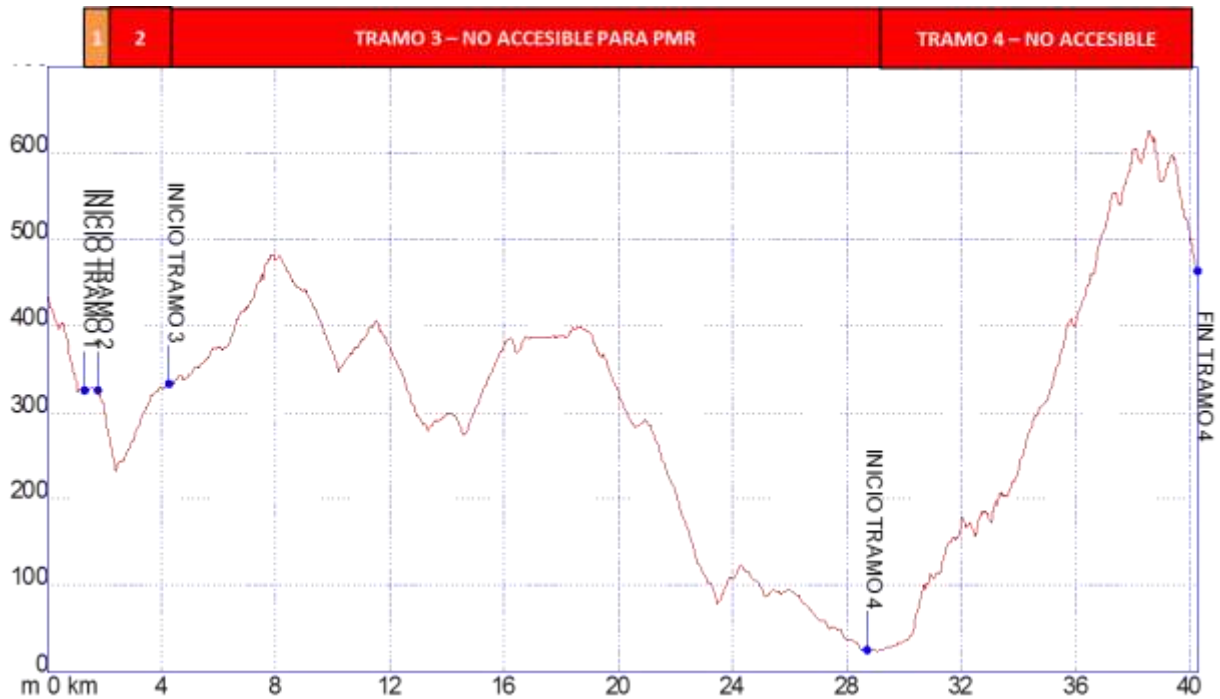
Gráfica I: Identificación tramos etapa32, nivel de accesibilidad.

➤ PERFIL ETAPA 32: Perfil de altitud e identificación por tramos.