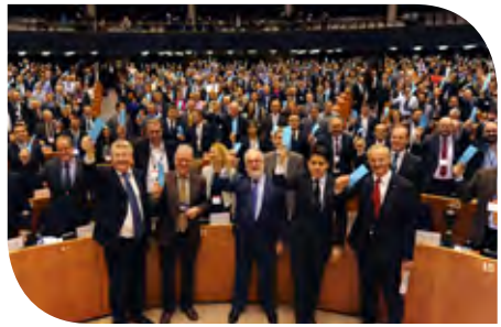
Los líderes y alcaldes de la UE respaldan de forma simbólica el Pacto de los Alcaldes para el Clima y la Energía en el Parlamento Europeo en 2015

Se comprometen a preparar Planes de Acción para la Energía Sostenible y el Clima para el año 2030 e implantar actividades locales de atenuación y adaptación al cambio climático .