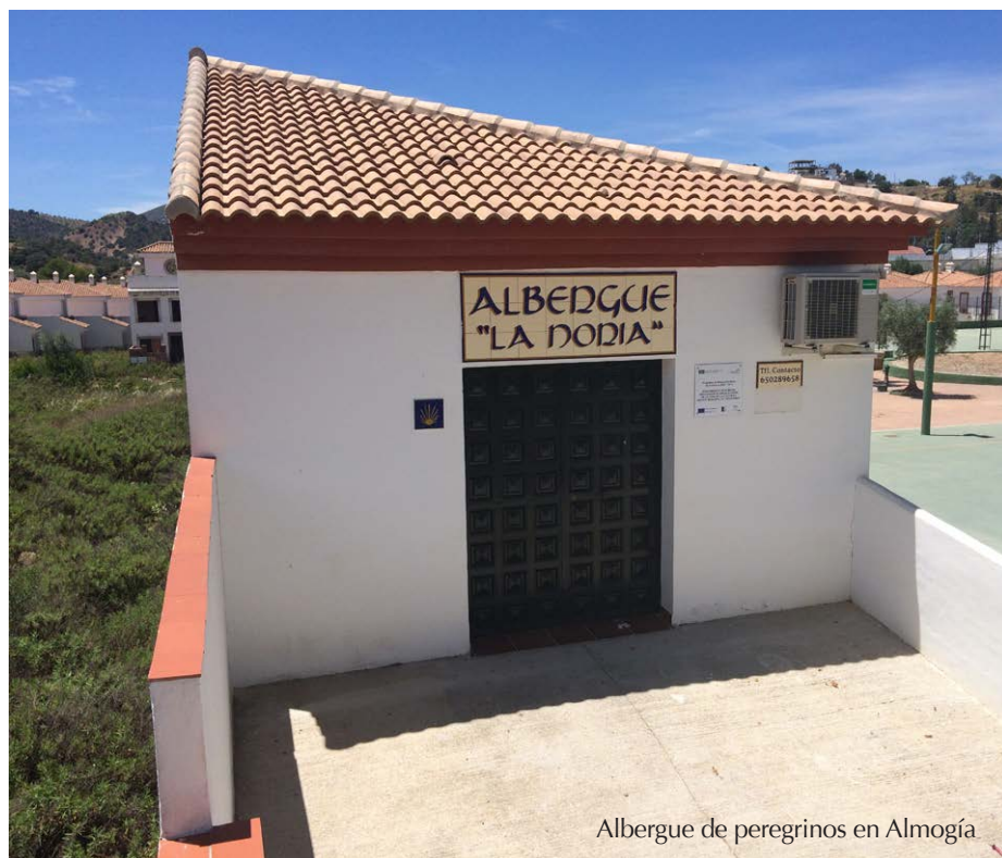
Albergue de peregrinos en Almogía