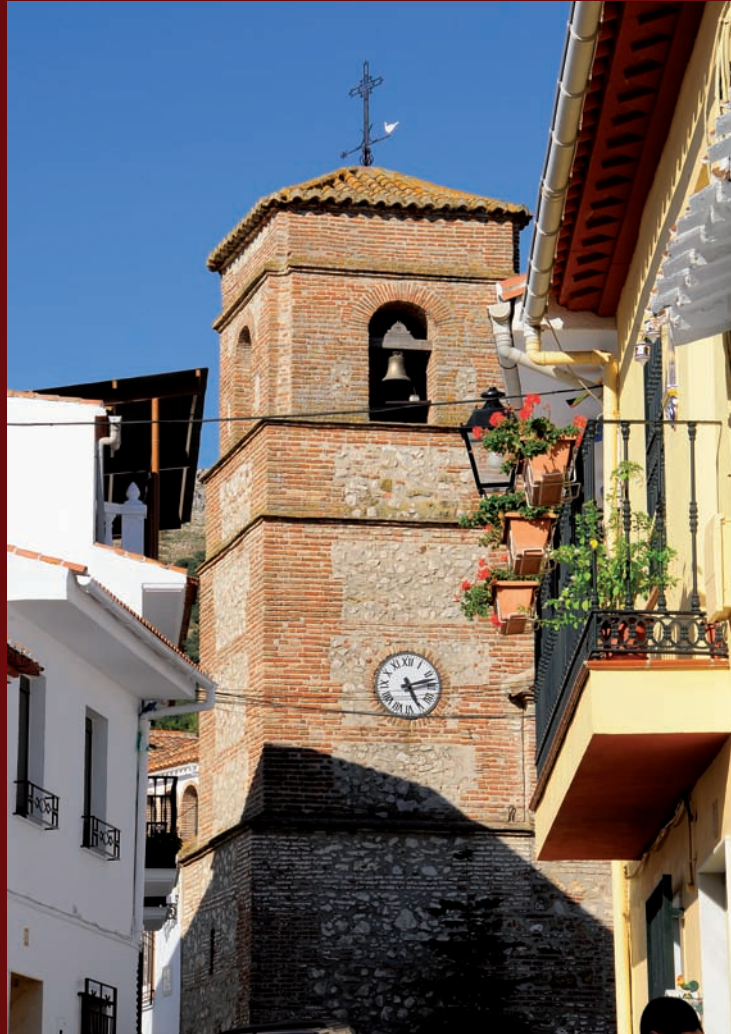
Torre del Santo Cristo de Cabrilla. ▲