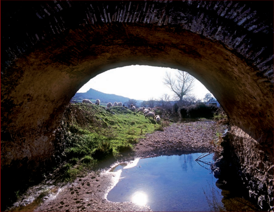
Puente del río Sabar. ▲