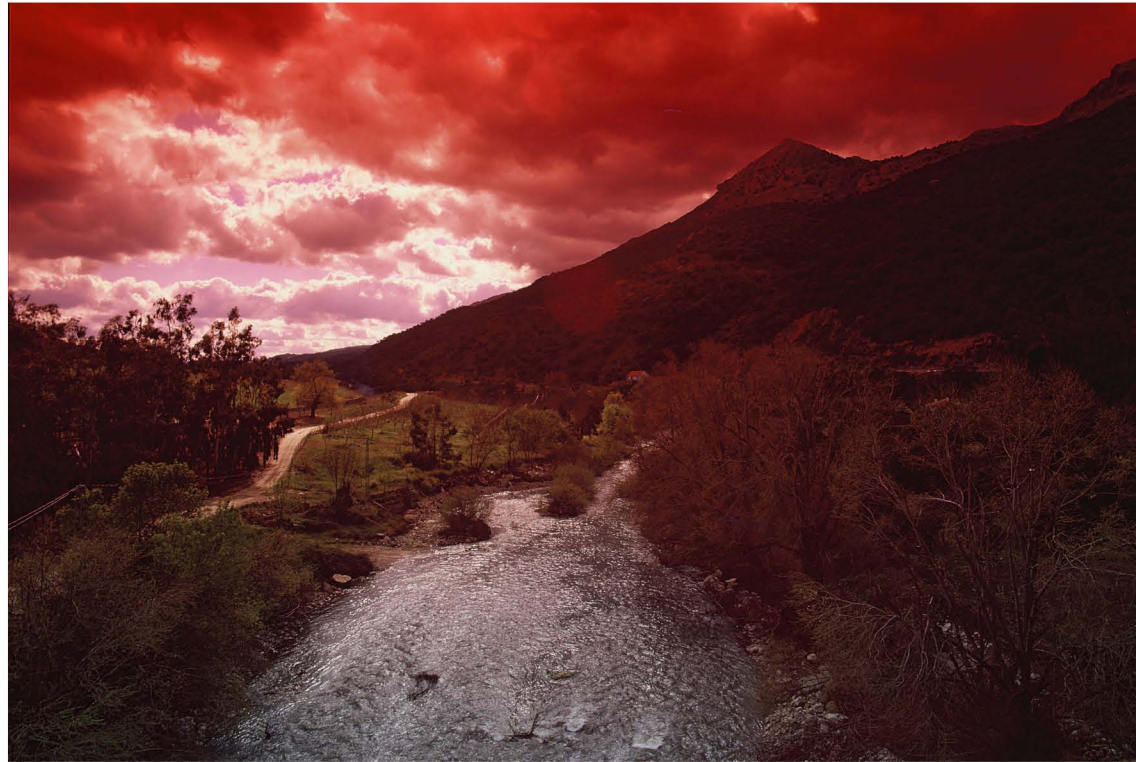
Rio Guadiaro ▲