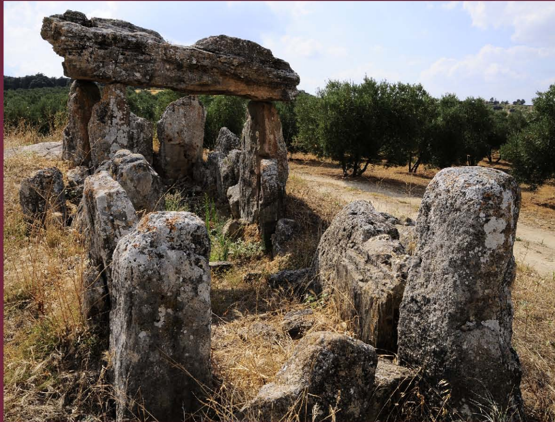
Dolmen de Piedra Caballera (Montecorto) ▲