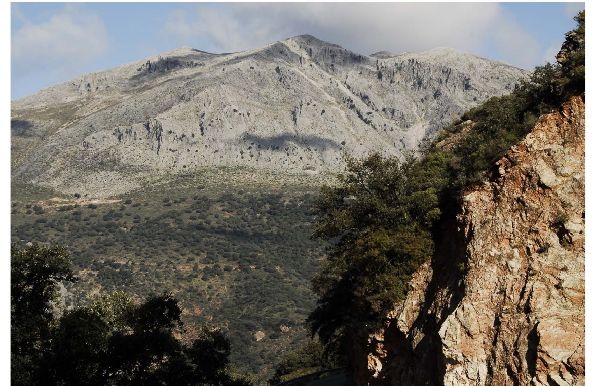
Macizo de Líbar ▲

Los municipios de Benaoján, Cortes de la Frontera, Jimera de Líbar, Montejaque y Montecorto se encuentran en la zona del valle del Guadiaro que discurre entorno al cauce del río Guadiaro, y que se adentra en los parques Naturales de la Sierra de Grazalema y de Los Alcornocales. El cauce del Guadiaro es el más importante de la Serranía de Ronda.