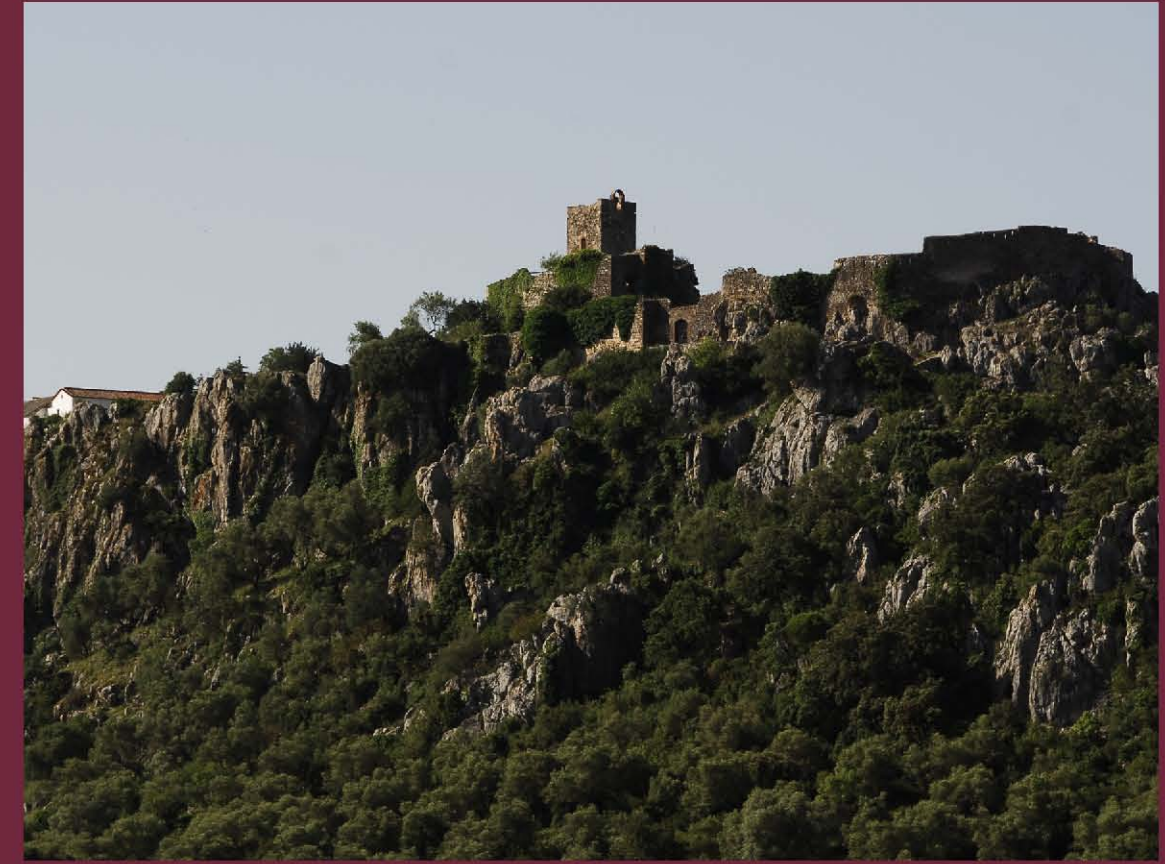
Castillo del Águila (Gaucín) ▲

edificio de planta trapezoidal que cuenta con tres torres cilíndricas, faltando una por derrumbe. El acceso principal se realiza por la base mayor de la planta, y está orientada al noroeste. En el centro del recinto hay también un aljibe subterráneo.