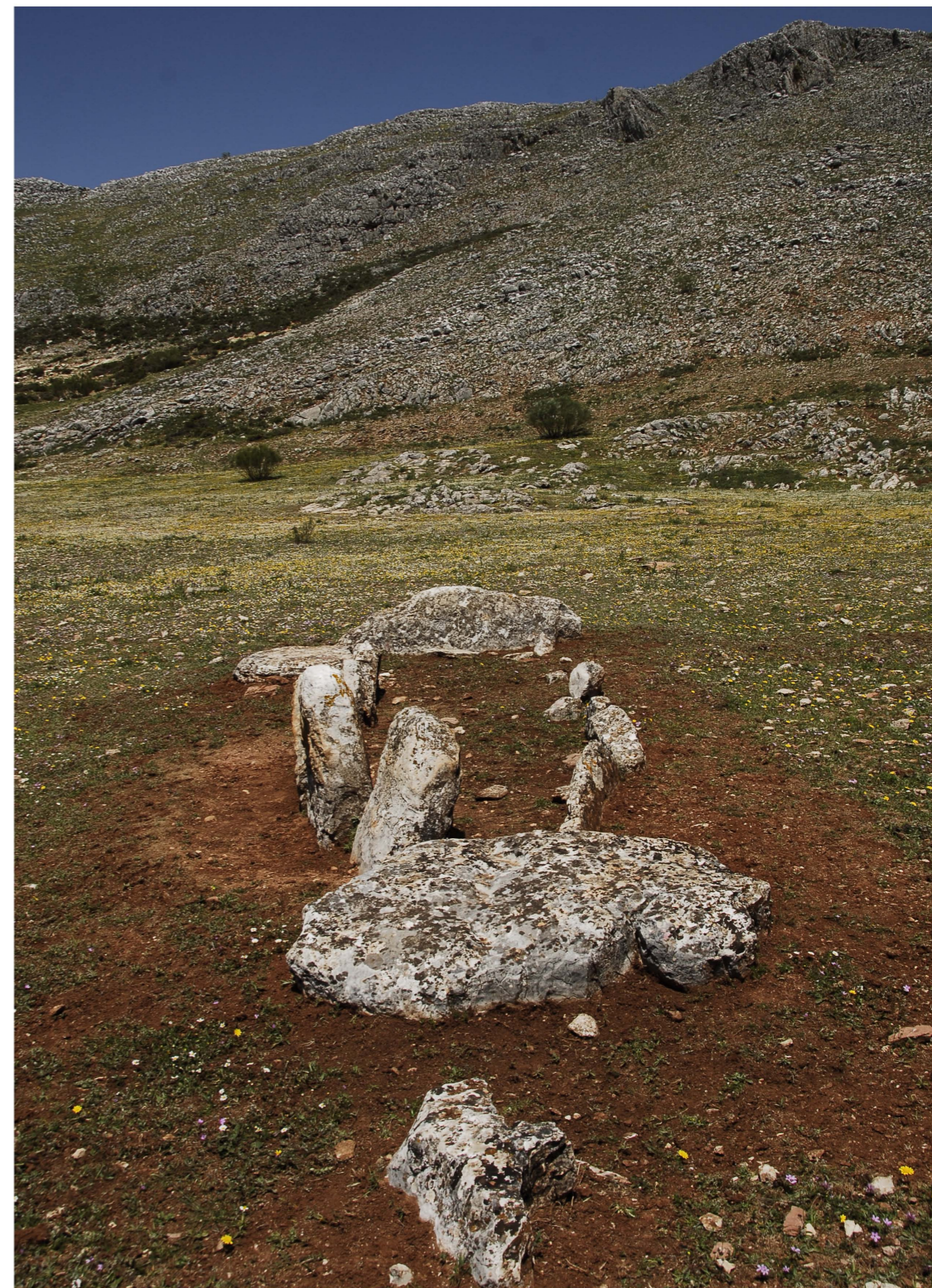
Dolmen de Encinas Borrachas (Alpendeire) ▲

tos prehistóricos de la ciudad. Los hallazgos más antiguos se remontan al Neolítico, teniendo continuidad en la Edad del Cobre y la del Bronce.