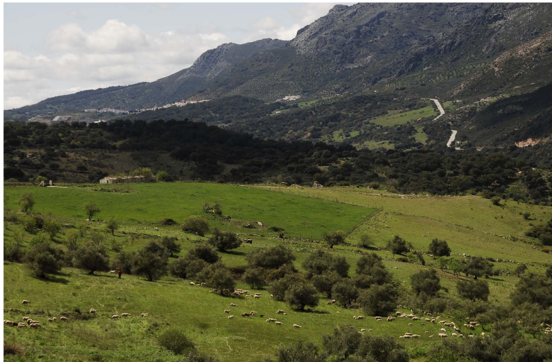
Valle del Guadiaro ▼