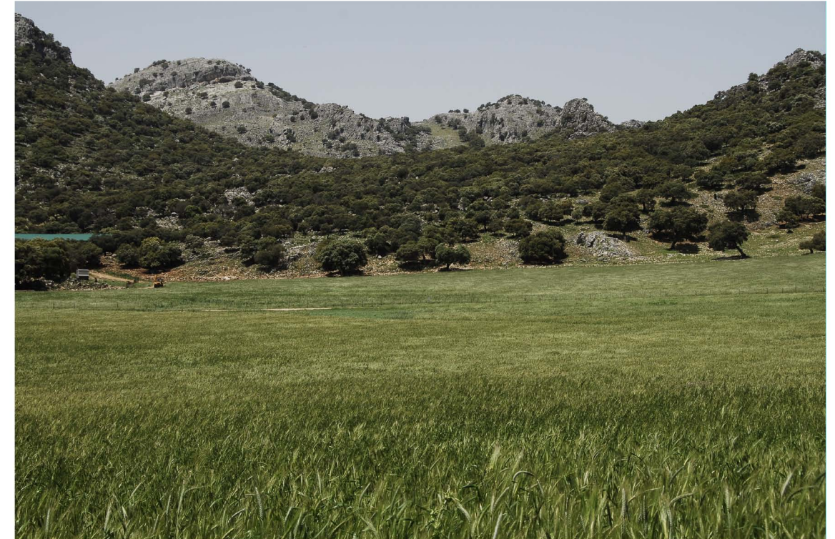
Llanos de Líbar ▼

Los Llanos de Líbar, situados en el macizo del mismo nombre constituye uno de los poljes más importantes de Andalucía. La ruta que discurre entre Cortes de la Frontera y Montejaque, con sus 17 kilómetros es una de las principales de la Serranía de Ronda.