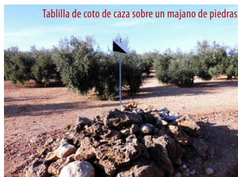
Tablilla de coto de caza sobre un majano de piedras

A veces hay manchas de jarales en las dehesas cinegéticas