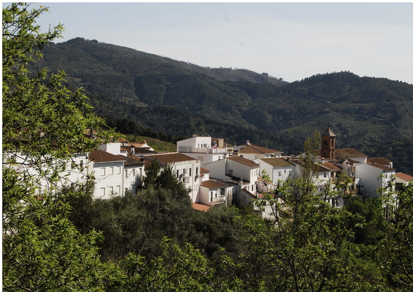
Vista parcial de Faraján. ▲