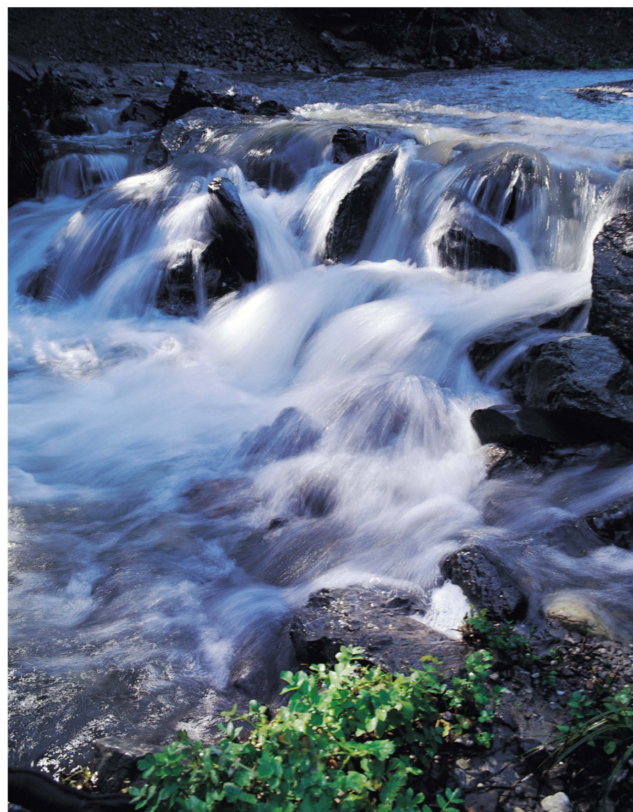
Río Genal y Valle ▲▶

E l valle del Genal comprende los pueblos de Algatocín, Alpandeire, Atajate, Benadalid, Benalauría, Benarrabá, Cartajima, Faraján, Gaucín, Genalguacil, Igualeja, Jubrique, Júzcar, Parauta y Pujerra, que forman uno de los parajes de la Serranía de Ronda que atesora una gran cantidad de ecosistemas naturales. Los 60 kilómetros que suman el río Genal y sus afluentes están jalonados por diferentes molinos y huertas familiares, además inmensos castaños. La biodiversidad de este valle ha sido reconocida por la Unión Europea como Lugar de Interés Comunitario (LIC), además de formar parte de la Reserva de la Biosfera Intercontinental del Mediterráneo declarada por la UNESCO.