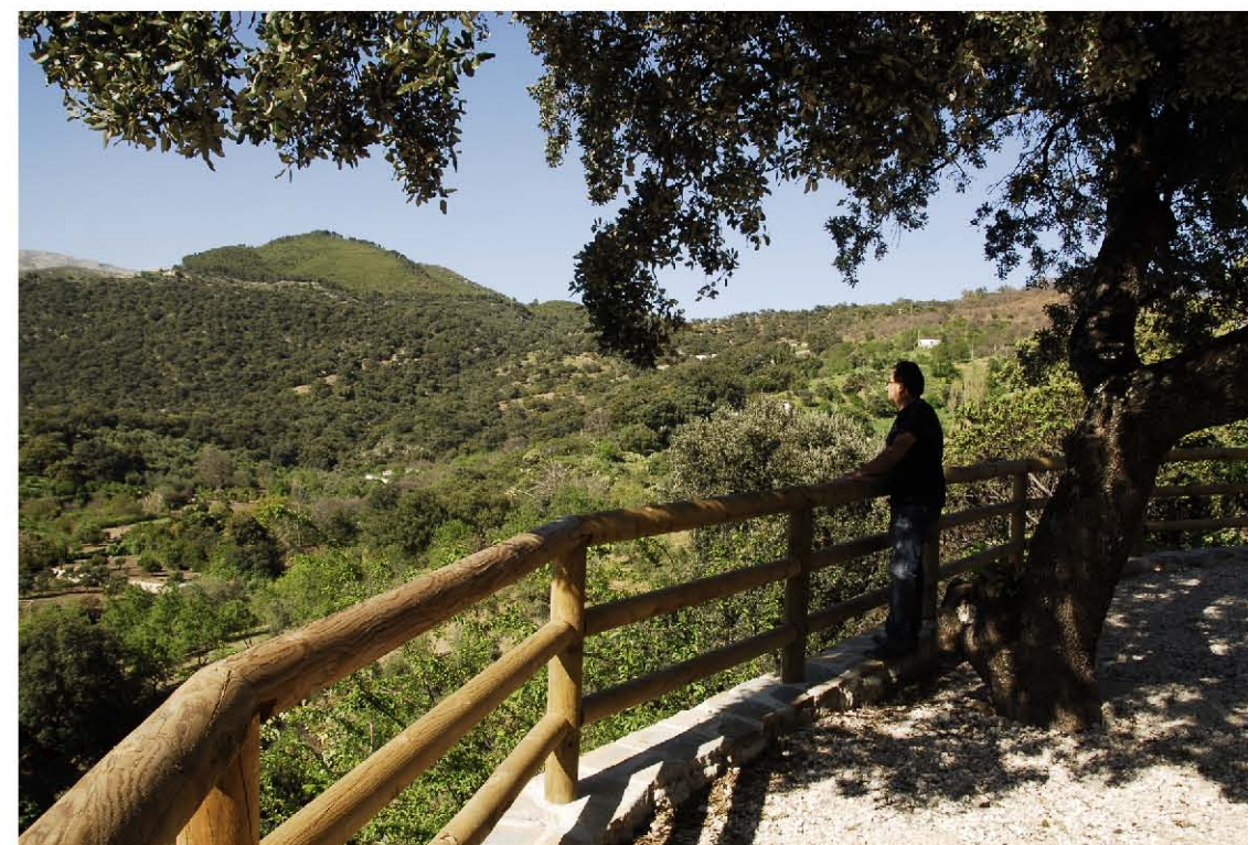
Mirador y huertas de Balastar. ▲▼