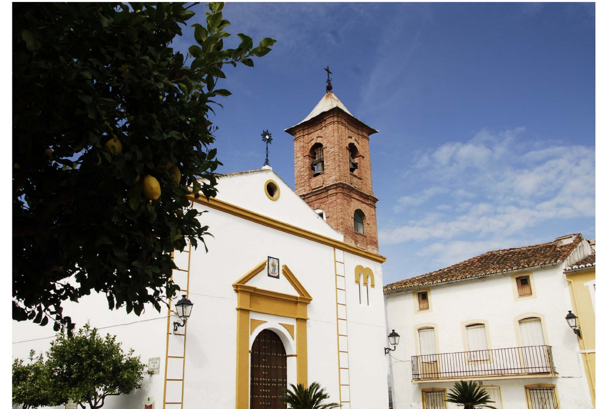
Iglesia Nuestra Señora del Rosario. ▲