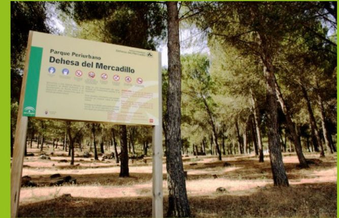
Sendero “Paco Marín”