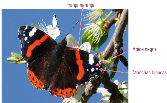
Borde ancho y naranja