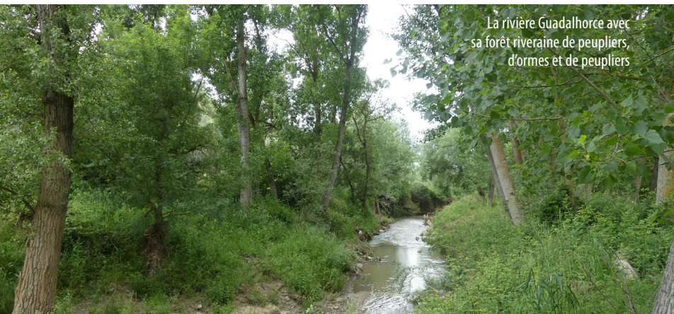
La rivière Guadalhorce avec sa forêt riveraine de peupliers, d'ormes et de peupliers