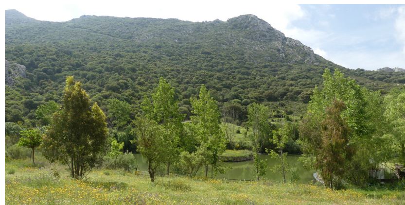
Les Navillas du ruisseau Yedra et Breña, des collines Cuca et Limón, derrière

et dans la zone connue sous le nom de Las Carboneras, avec quelques ruines d'anciennes fermes. La végétation est très dense, la rivière gagne en vitesse en générant des petites cascades et bientôt elle s'ouvre dans une nouvelle tâche. Elle débouche sur le chemin qui pourrait servir de voie d'évacuation en cas de crue de la rivière, toujours vers le nord. La Gran Senda del Guadalhorce se termine au carrefour, qui est suivie en aval par une dérivation vers le nord à travers une gorge très accidentée, recommandée pour l'observation de la faune, tandis que la Variante continue l'ascension immédiate vers l'ouest, seule, du point le plus bas de la journée à 600 mètres d'altitude.