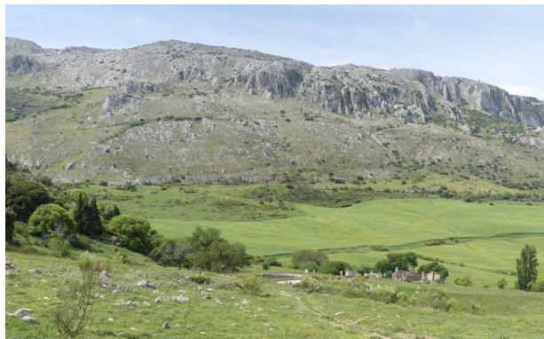
Paysage mixte de montagnes et de champs de travail dans la ferme des Alhajuelas

Le plus grand succès de l'itinéraire est la découverte de la Forêt Publique de la Alhajuela-Cortijo Guerrero et ses environs. C'est une large extension de collines gypseuses, marneuses et argileuses qui génèrent des paysages assez particuliers, de vallons, de maquis aromatiques ou reboisés de conifères. Ce même matériau, imperméable et situé sous le calcaire des montagnes, provoque des sources d'une certaine importance, certaines aussi célèbres comme le Nacimiento de la Villa. Les alentours du village et la ville de Torcal ont une histoire relativement récente, comme l'indique le nom de Villanueva (ville neuve), qui est devenue indépendante d'Archidona au XVI e siècle, étant délimitée précisément par les rives du Guadalhorce. C'est alors au kilomètre 7 que la Randonnée entre à Antequera. ▶