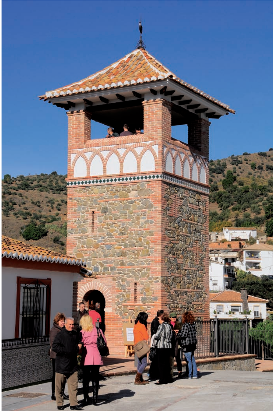
▲ Mirador de la Torre del Violin.