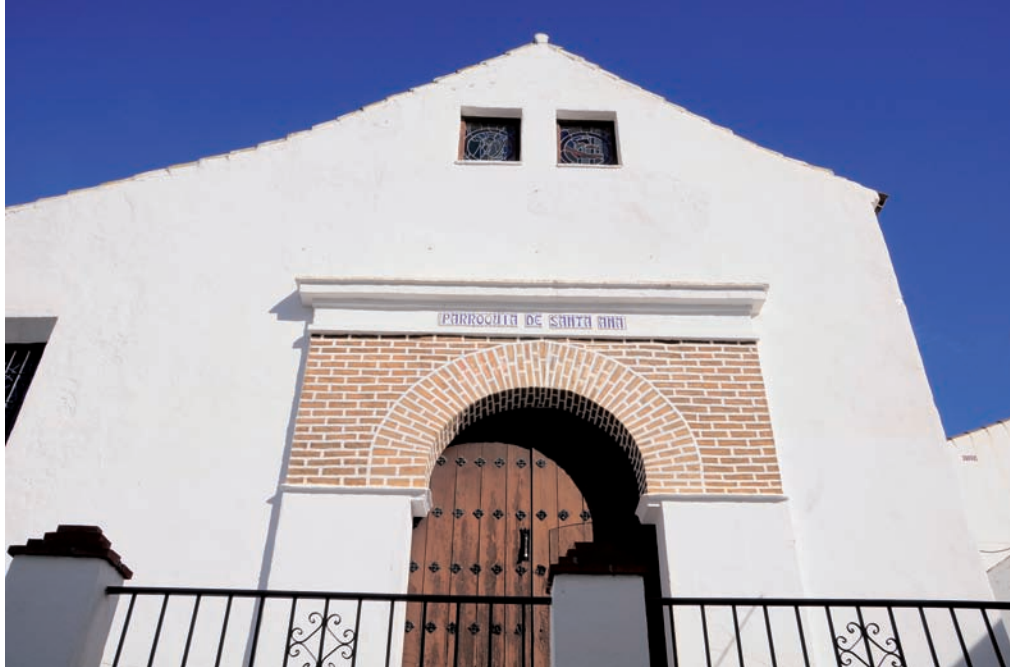
▲ Iglesia de Santa Ana.