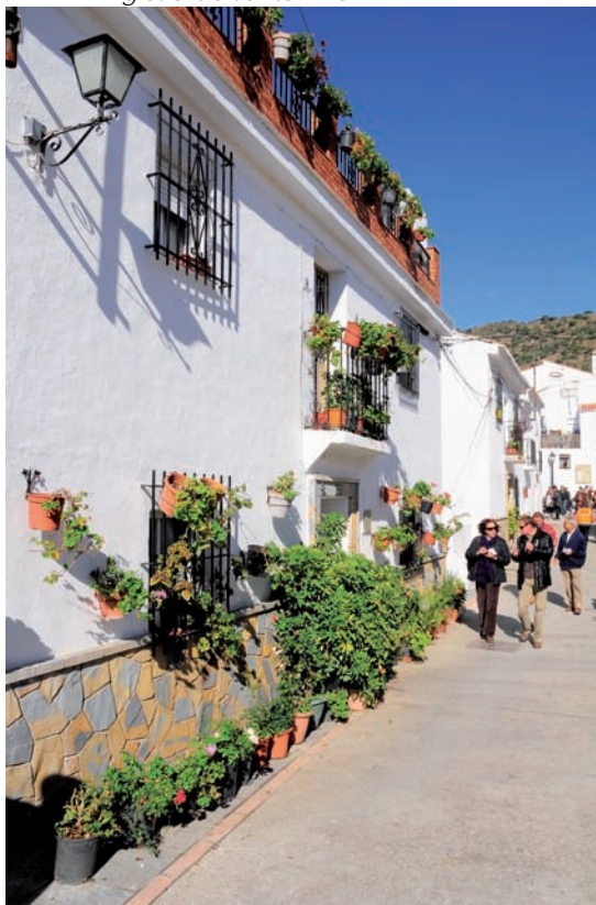
▲ Calles típicas.