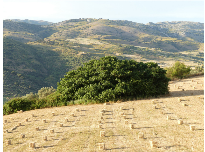
Bottes de foin avec le paysage de la vallée du Guadiaro

3.4 kilomètres ont déjà été parcourus lorsque l'altitude la plus élevée de l'Étape est atteinte, précisément dans la ferme où se trouve la chapelle Cruz del Milagro, avec un panneau d'interprétation sur la curieuse histoire qui s'est produite lors d'une épidémie à Ronda. La route que le cortège a pris, bien que dans le sens opposé à celle décrite, est celle de l'ancien Camino de Ronda, le plus direct et qui franchit moins de dénivelés. Un panorama très puissant de montagnes calcaires gris s'ouvre alors devant le Sentier, mais les profils accidentés sont dominés par un vaste poljé très allongé et parfois cultivé. Au sud, vous pouvez voir une gorge étroite, traversée par la tyrolienne aérienne de la via ferrata de Montejaque, de l'autre côté.