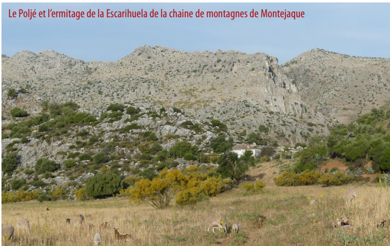
Le Poljé et l'ermitage de la Escarihuela de la chaîne de montagnes de Montejaque

la Concepción à laquelle le miracle susmentionné fait allusion. À partir de là, tout est en descente, et emprunte un de ces chemins qui sont une référence pour les randonneurs. Malgré quelques travaux de restauration qui ont cimenté l'ancien dallage en pierre, il reste encore une longue section où l'on peut constater l'extraordinaire qualité du chemin traditionnel. Le nom de l'Escarihuela fait référence aux gouttières et aux marches qui jalonnent la descente, particulièrement remarquables dans chacune des courbes, en forme d'éventail. Un événement sportif célèbre utilise traditionnellement ce même tracé, dans le sens de déplacement décrit, et cette image du chemin traditionnel entre Montejaque et Ronda est une des plus connues. La descente se termine près du cimetière de Montejaque, et l'Étape se termine sur la route d'accès au village, qui se trouve au sud-ouest. ■