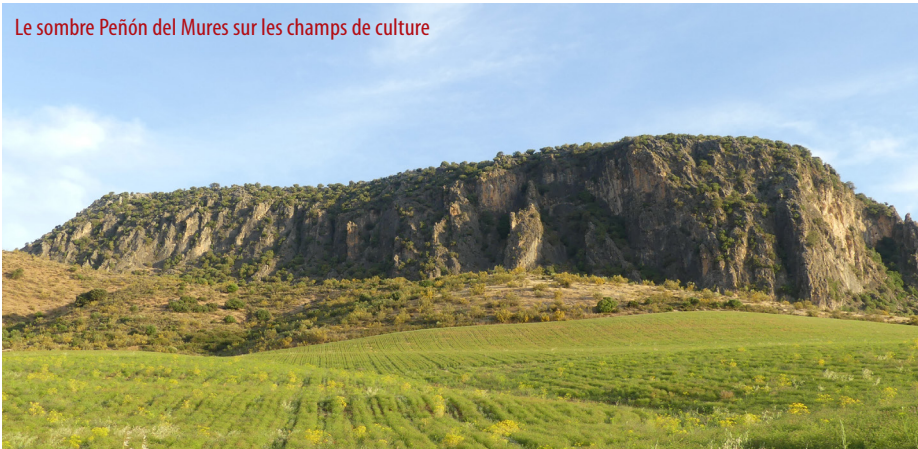
Le sombre Peñón del Mures sur les champs de culture

Le changement de municipalité entre Ronda et Montejaque se produit également au kilomètre 2.2, juste à l'endroit où arrive la zone nord-est de la municipalité de Benaoján, qui n'est pas traversée. L'ensemble du parcours, d'autre part, passe à l'intérieur du Parc Naturel de la Sierra de Grazalema, dont la limite se trouve précisément sur le chemin le long duquel passe le Sentier de Grande Distance parent, parallèle à la ligne ferroviaire Algeciras - Bobadilla. ▶