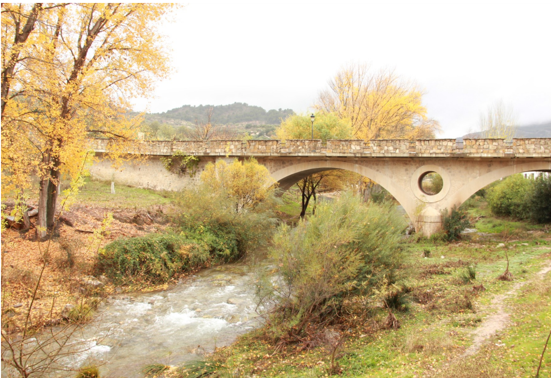
Puente de la A-366 sobre el río Turón a la entrada de El Burgo